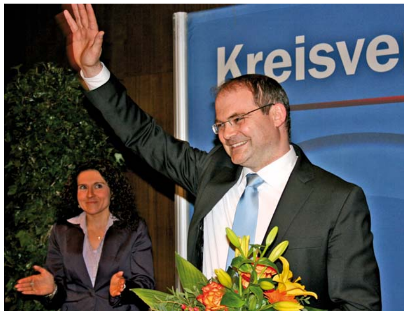
Mit großer Rückendeckung in die nächste Landtagswahl

Bedanken möchte ich mich aber auch bei all denjenigen, die mich während der letzten fünf Jahre unterstützt und begleitet haben. Denn Erfolg hat bekanntlich viele Väter und Mütter.