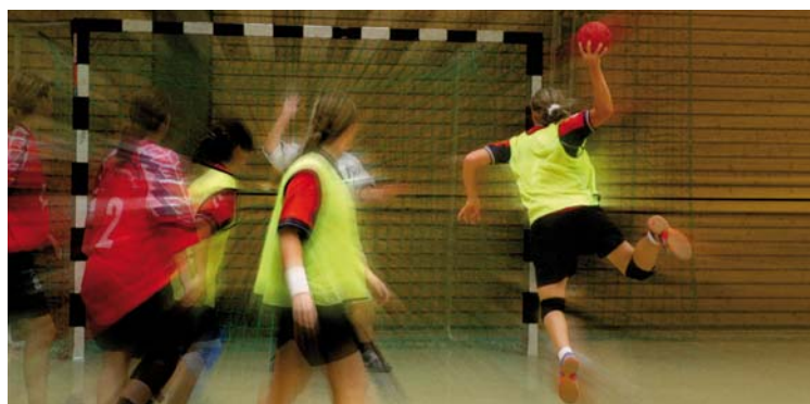
Ausbau des kommunalen Sportstättenbaus

gungen entscheidend verbessert werden. Und davon partizipiert der ganze Landkreis Rottweil – gewinnt er doch weiter an Attraktivität.