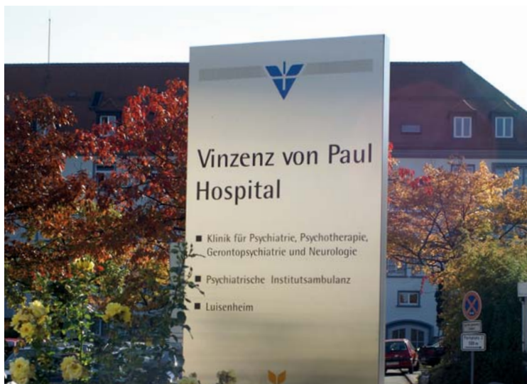
Vinzenz von Paul Hospital erhält Zentrum für Altersmedizin

Der vom Landtag verabschiedete Staatshaushaltsplan sieht für dieses Jahr 337 Millionen Euro und für 2011 332 Millionen Euro für