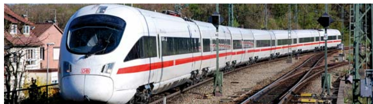
Ausbau der Gäubahn erhält weiteren Schub

Bereits mehrfach habe ich hier über die Notwendigkeit des Ausbaus der Gäubahn berichtet. Denn die Eisenbahninfrastruktur muss in allen Regionen unseres Landes vorangetrieben werden – nicht nur in den Ballungsgebieten.