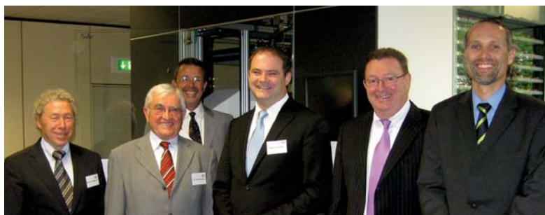
„Außen Marke – innen BDT“ so das Credo der Führungsmannschaft der Firma BDT

Die Enquetekommission wird sich im Zuge ihrer Arbeit auch über die beruflichen Schulen und das Ausbildungssystem in der Schweiz informieren. Außerdem wird es öffentliche Expertenanhörungen geben, die sich mit der Sicherung des Fachkräftebedarfs beschäftigen werden.