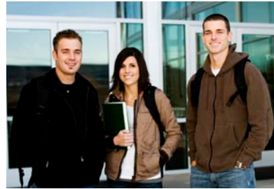
Diözese „Rottenburg-Stuttgart“ errichtet.

Die Stiftung St. Franziskus Heiligenbronn ist eine kirchliche Stiftung öffentlichen Rechts und verfolgt ausschließlich gemeinnützige, mildtätige und kirchliche Zwecke. Sie wurde im März 1991 von Dr. Walter Kasper, Bischof der