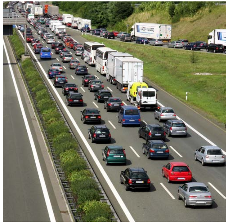
Allein im letzten Jahr gab es auf Deutschlands Autobahnen 375.000 Kilometer Stau

Ganz zu schweigen von den volks- und betriebswirtschaftlichen Schäden, die durch Staus entstehen. Allein im letzten Jahr gab es auf Deutschlands Autobahnen 375.000 Kilometer Stau. Dies entspricht der Entfernung der Erde zum Mond. Ursache für die „schleichenden Blechlawinen“ sind Unfälle, Pannen und Baustellen. Der daraus entstehende Schaden für Zeitverlust und Spritvergeudung wird laut ADAC auf einen