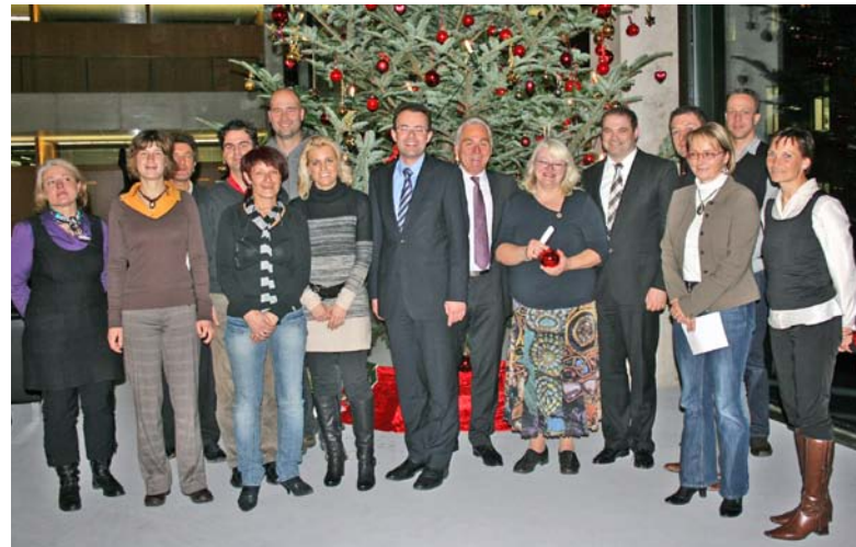
Der CDU Arbeitskreis Bildung und die geladenen Gäste