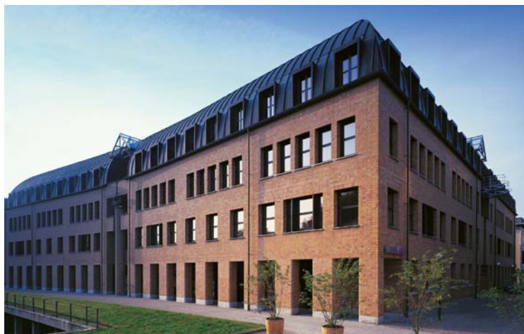
Die L-Bank (Landeskreditbank Baden-Württemberg) in Karlsruhe

Bis zum Jahresende werden voraussichtlich mehr als 1400 Bürgschaften für mittelständische Betriebe seitens der Landesregierung übernommen. Das Gesamtvolumen dürfte bei rund 190 Millionen Euro liegen.